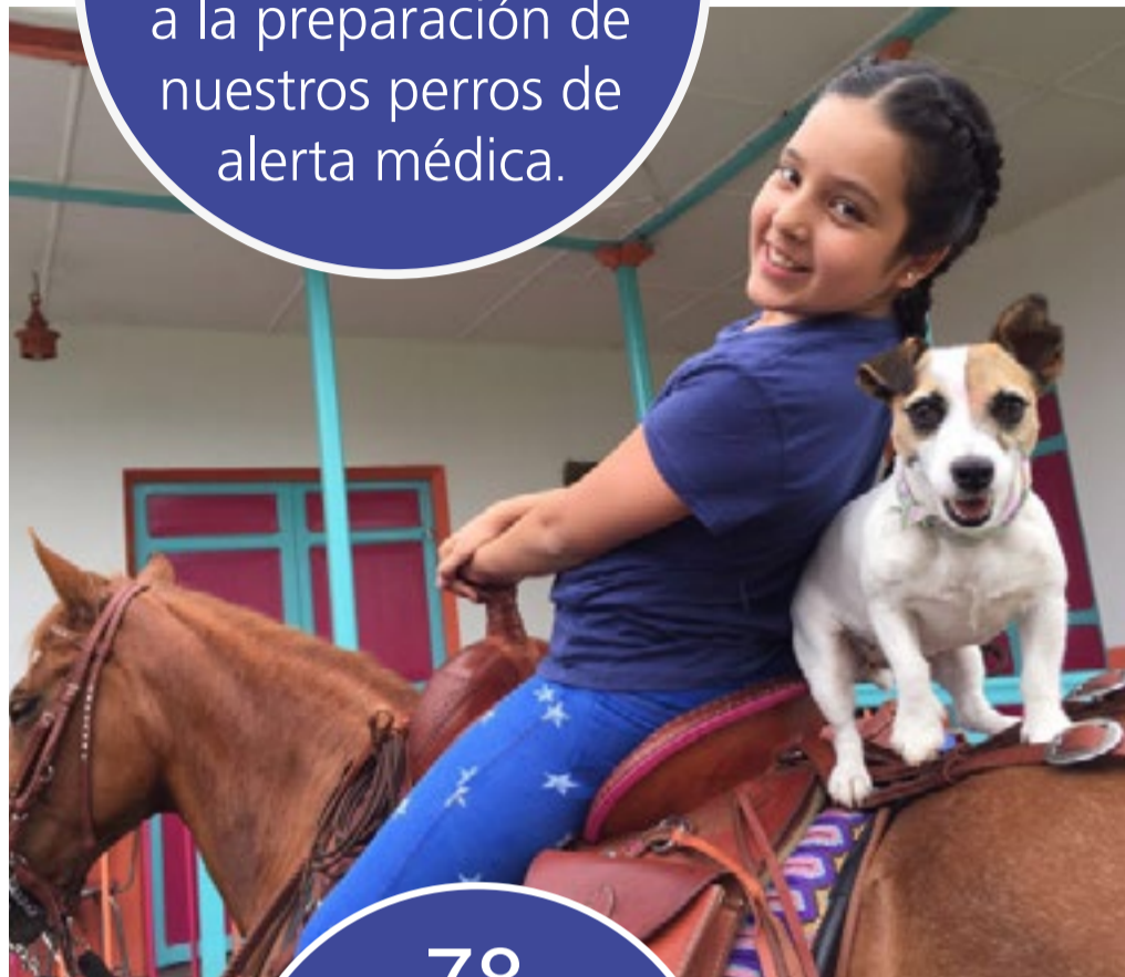
Proyecto Sofía y Barbie (Bogotá) ▷