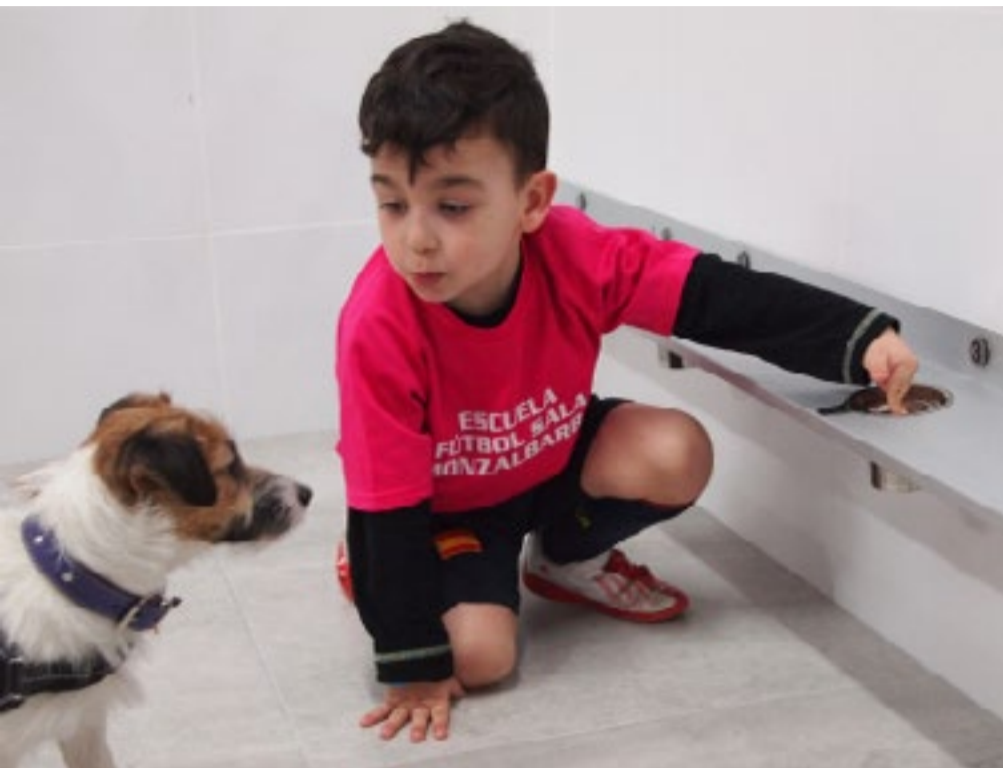
△ Proyecto Erik y Sweet (Zaragoza)

Todas las donaciones recibidas contribuyen a la preparación de nuestros perros de alerta médica.