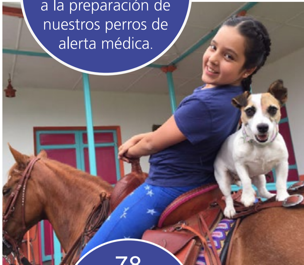
Proyecto Sofía y Barbie (Bogotá) ▷